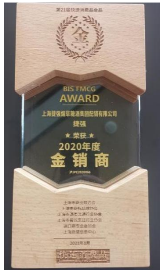
2020 年快消品综合实力经销商