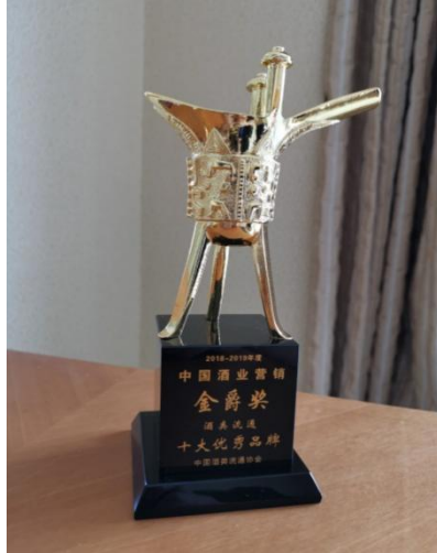
中国酒类流通协会优秀会员